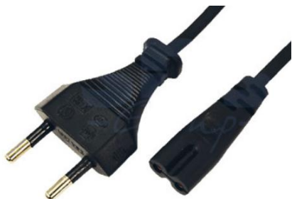
Артикул Q-3069 (прямой)